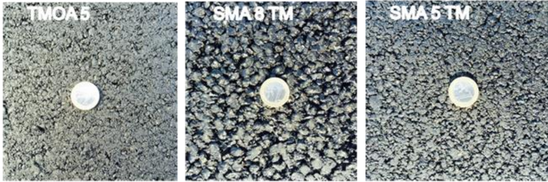
VG TU Kelių tyrimo instituto mokslininkų sukurtų mažatriukšmių asfalto dangų tekstūros skirtumai