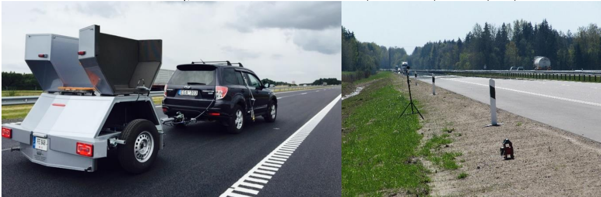
VG TU Kelių tyrimo instituto atliekami mažatriukšmių asfalto dangų tyrimai specialia padangos ir dangos kontakto metu susidarančio triukšmo lygio nustatymo įranga