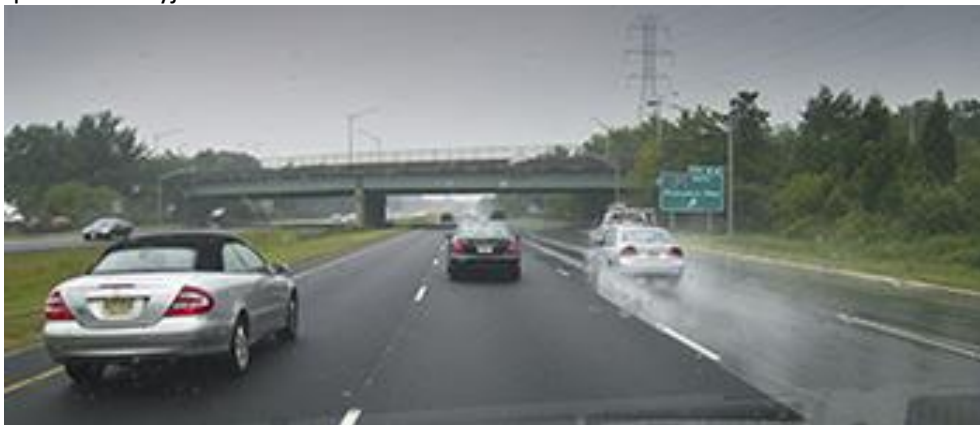
Dešinėje – purliojimo reiškinio susidarymas ant tradicinių asfalto dangų, o kairėje – ant mažatriukšmių